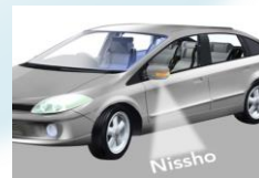
プロジェクションフィルム

ご来訪の際は事前に弊社営業担当までお知らせ頂けると幸いです 社員一同、ご来場を心よりお待ちしております